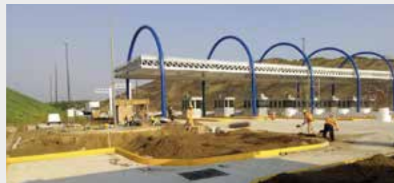
Caseta Arco Norte