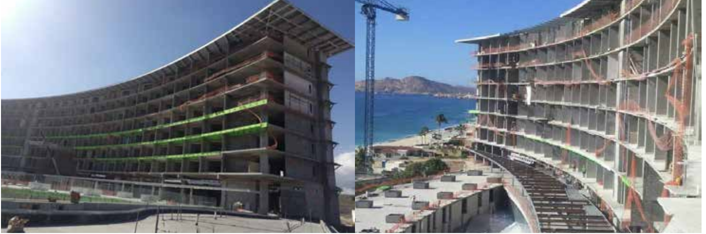
Hotel Le Blanc, Los Cabos

ROMANTER se compromete con la ejecución de obras y proyectos de alta calidad para satisfacer las necesidades específicas de nuestros clientes. Nuestra permanencia en el mercado, el crecimiento de los accionistas y el desarrollo de nuestros colaboradores dependen de ello.