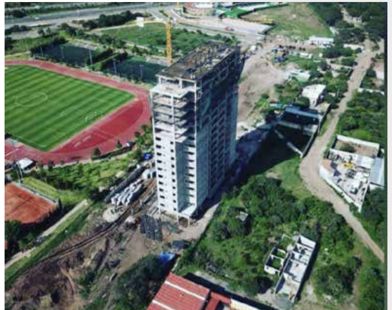
La Loma Juriquilla

Romanter garantiza proyectos que superan las expectativas de nuestros clientes, construyendo confianza y destacando por la calidad de nuestras obras y el talento de nuestro equipo.