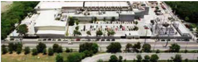
SEGURIDAD Y PROTECCIÓN