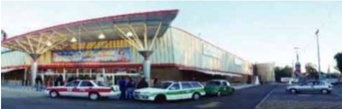
INSTITUCIONAL - COMERCIAL